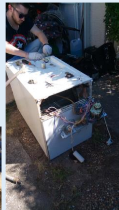
La machine à laver